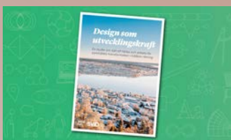
Rapporten Design som utvecklingskraft