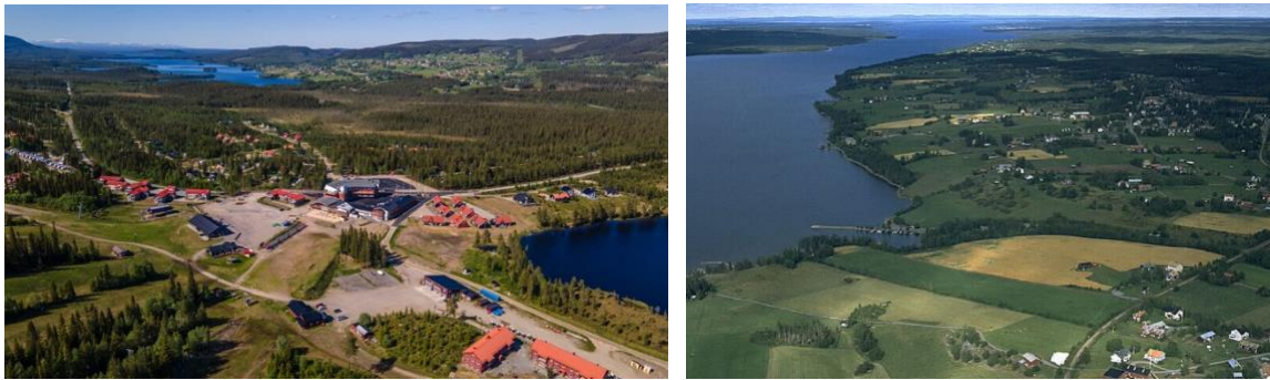
Figur 1: Klövsjöfjäll (Destination Vemdalen, 2020)