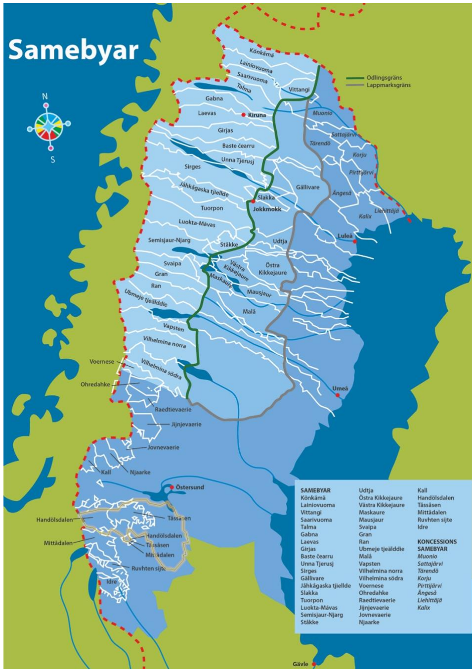
Figur 4: Karta över samebyar (Sunesson, 2017). Bergs kommun ungefärligt markerad i gult av Karolina Nätterlund.

Bergs kommun ingår i samiskt förvaltningsområde och överlappar geografiskt med fyra samebyar; Tossåsen, Handölsdalen, Mittådalen och Njarke (vinterbete). Samiska rådet i Bergs kommun har som uppgift att vara delaktigt i alla frågor som berör samerna i kommunen samt att verka som styr- eller referensgrupp vad gäller fördelning av kommunens del av det förstärkta skyddet för minoritetsspråket samiska. (Bergs kommun, 2021)